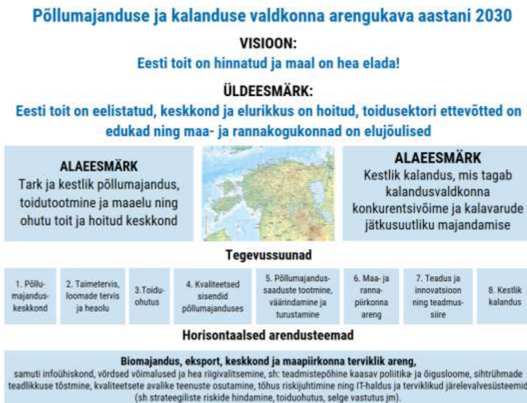
Joonis 1. Arengukava struktuur

Järgnev joonis kirjeldab arengukava struktuuri ja eesmärkide hierarhiat, kus kaheksa tegevussuuna mõjueesmärgid on seotud üldeesmärgiga kahe programmilise alaeesmärgi kaudu.